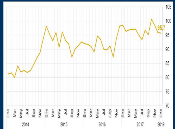
Gráfico 1: EE.UU. - Índice de sentimiento del consumidor (En puntos)