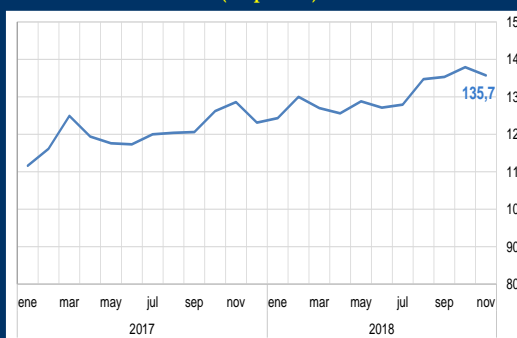
Gráfico 2: EE.UU. - Confianza del consumidor (En puntos)