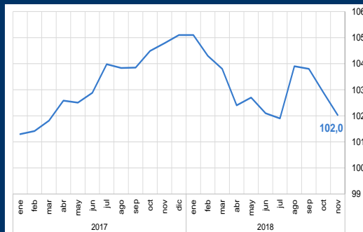
Gráfico 1: Alemania - Clima empresarial (En puntos)