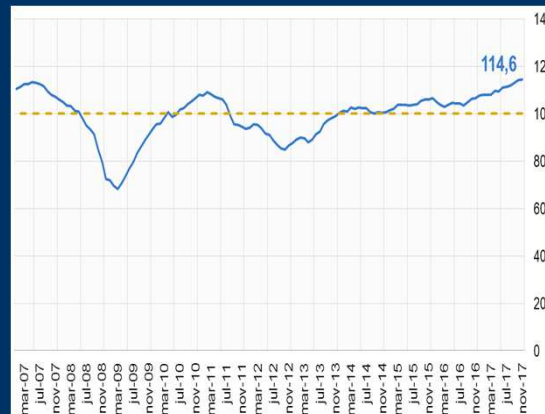
Gráfico 2: Zona Euro - Índice de sentimiento económico (En puntos)

1 A partir del 15/11/2017, los activos del FPAH son invertidos de acuerdo a la composición por monedas de los depósitos del público en el sistema financiero, de manera análoga a las inversiones realizadas por el FONDO RAL.