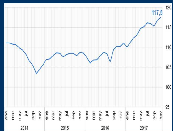
Gráfico 2: Alemania - Índice de clima empresarial (En puntos)