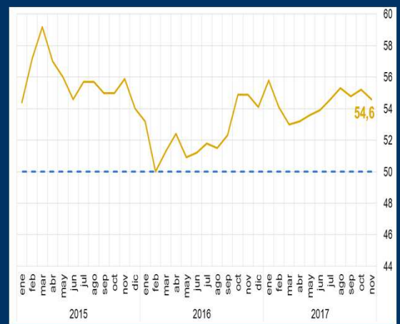
Gráfico 1: EE.UU. - Índice PMI compuesto (En puntos)

NOTA: 1 A partir del 15/11/2017, los activos del FPAH son invertidos de acuerdo a la composición por monedas de los depósitos del público en el sistema financiero, de manera análoga a las inversiones realizadas por el FONDO RAL.