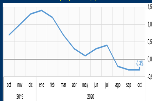
Gráfico 1: Zona Euro - Inflación interanual (En porcentaje)

1 A partir del 15/11/2017, los activos del FPAH son invertidos de acuerdo a la composición por monedas de los depósitos del público en el sistema financiero, de manera análoga a las inversiones realizadas por el FONDO RAL.