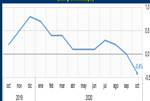
Gráfico 2: Japón - Inflación interanual (En porcentaje)