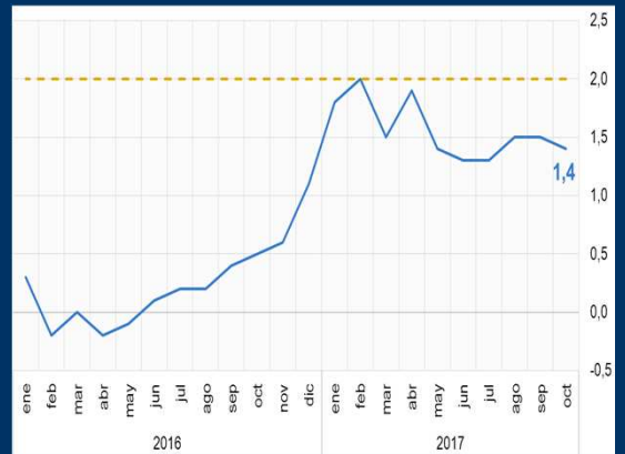
Gráfico 1: Zona Euro - Inflación interanual (En porcentaje)