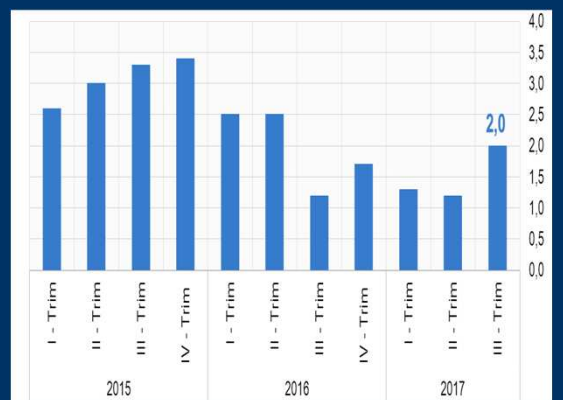
Gráfico 3: Colombia - Actividad económica (En porcentaje)