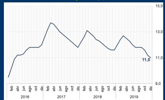
Gráfico 2: Brasil - Tasa de desempleo mensual (En porcentaje)