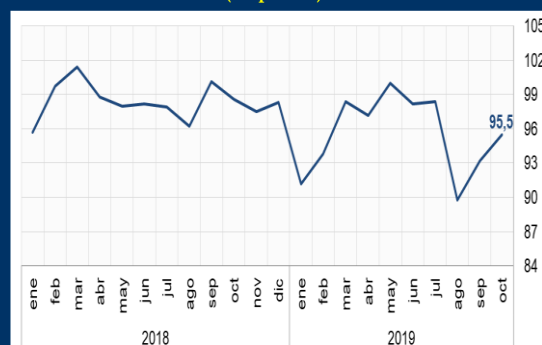
Gráfico 1: EE.UU. - Sentimiento del consumidor (En puntos)

NOTA: 1 A partir del 15/11/2017, los activos del FPAH son invertidos de acuerdo a la composición por monedas de los depósitos del público en el sistema financiero, de manera análoga a las inversiones realizadas por el FONDO RAL.