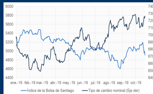
Gráfico 1: Chile - Tipo de cambio nominal e Índice de la Bolsa de Santiago (Peso chileno por unidad de dólar estadounidense, en puntos)

NOTA: 1 A partir del 15/11/2017, los activos del FPAH son invertidos de acuerdo a la composición por monedas de los depósitos del público en el sistema financiero, de manera análoga a las inversiones realizadas por el FONDO RAL.