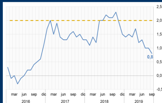
Gráfico 1: Zona Euro - Inflación (Variación interanual; en porcentaje)

1 A partir del 15/11/2017, los activos del FPAH son invertidos de acuerdo a la composición por monedas de los depósitos del público en el sistema financiero, de manera análoga a las inversiones realizadas por el FONDO RAL.