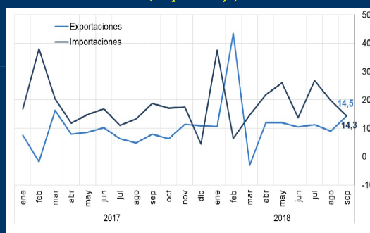
Gráfico 3: China - Crecimiento interanual de exportaciones e importaciones (En porcentaje)