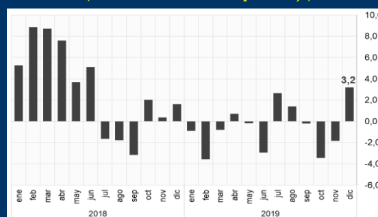
Gráfico 3: Chile - Producción industrial (Variación interanual; en porcentaje)