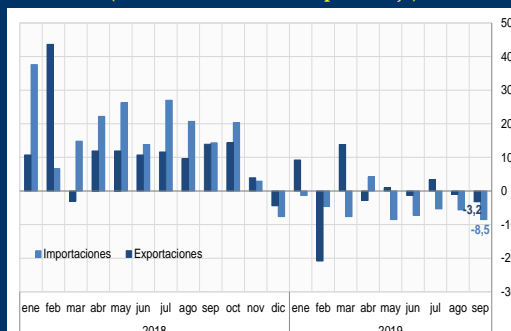
Gráfico 1: China - Exportaciones e importaciones (Variación interanual; en porcentaje)