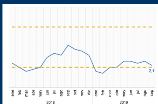
Gráfico 3: Chile - Inflación (Variación interanual; en porcentaje)