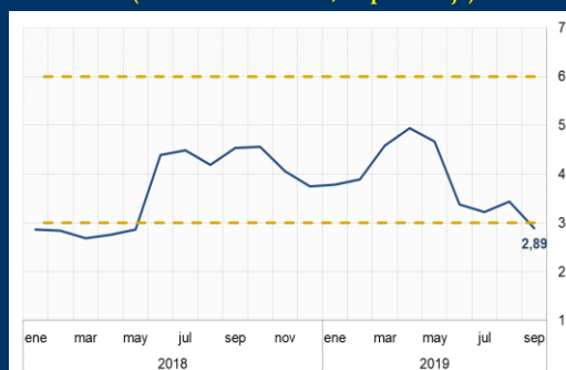
Gráfico 2: Brasil - Inflación (Variación interanual; en porcentaje)