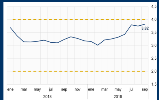
Gráfico 2: Colombia - Inflación (Variación interanual; en porcentaje)