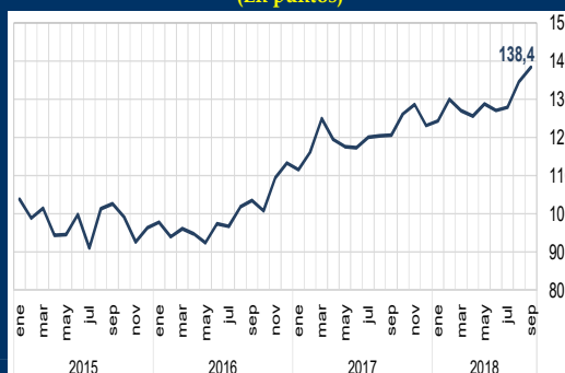
Gráfico 2: EE.UU. - Confianza del consumidor (En puntos)