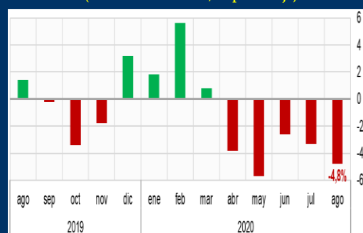
Gráfico 3: Chile - Producción industrial (Variación interanual, en porcentaje)