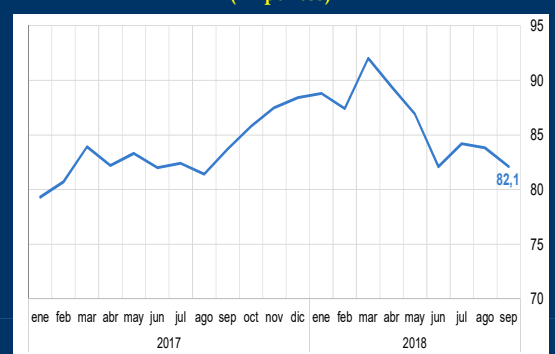
Gráfico 2: Brasil - Confianza del consumidor (En puntos)