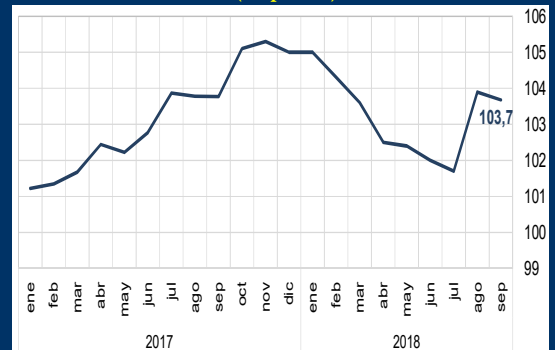
Gráfico 1: Alemania - Clima de negocios (En puntos)