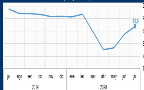
Gráfico 1: Japón - Índice económico líder (En puntos)