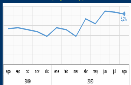
Gráfico 2: México - Tasa de desempleo (En porcentaje)