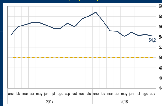
Gráfico 2: Zona Euro - PMI compuesto (En puntos)