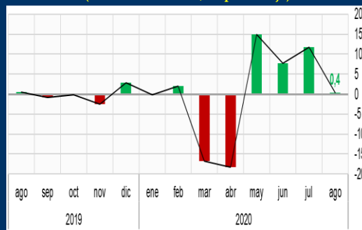
Gráfico 1: Estados Unidos - Pedidos de bienes duraderos (Variación mensual, en porcentaje)