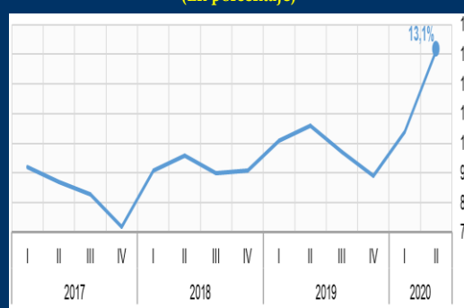
Gráfico 2: Argentina - Tasa de desempleo (En porcentaje)