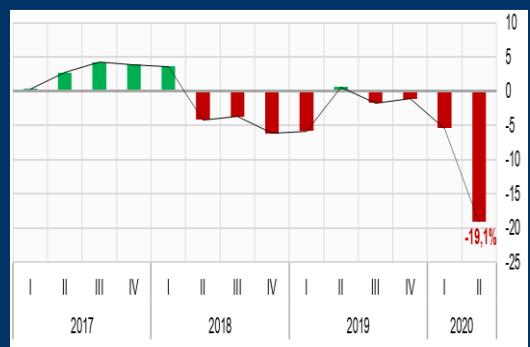
Gráfico 3: Argentina - Producto Interno Bruto (Variación interanual, en porcentaje)