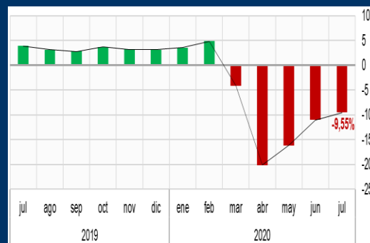
Gráfico 3: Colombia - Indicador de seguimiento a la economía - ISE (Variación interanual, en porcentaje)