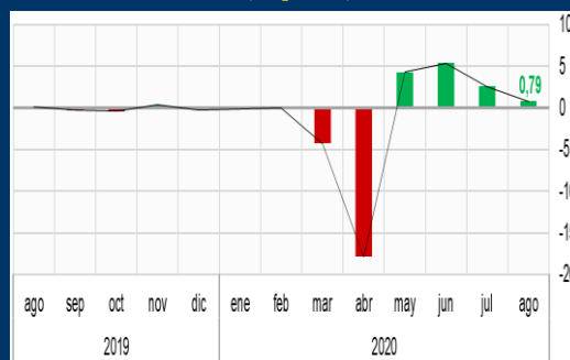
Gráfico 1: Estados Unidos - Índice de Actividad Nacional - CFNAI (En puntos)

Nota: Un valor de 0 indica que la economía se está expandiendo a su tasa histórica de crecimiento