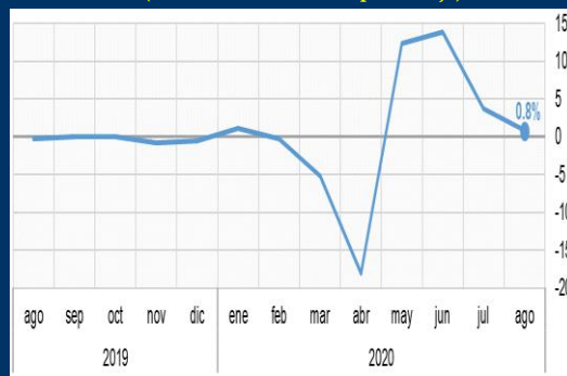
Gráfico 3: Reino Unido - Ventas minoristas (Variación mensual, en porcentaje)