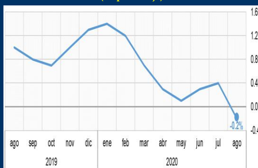
Gráfico 2: Zona Euro - Inflación interanual (En porcentaje)