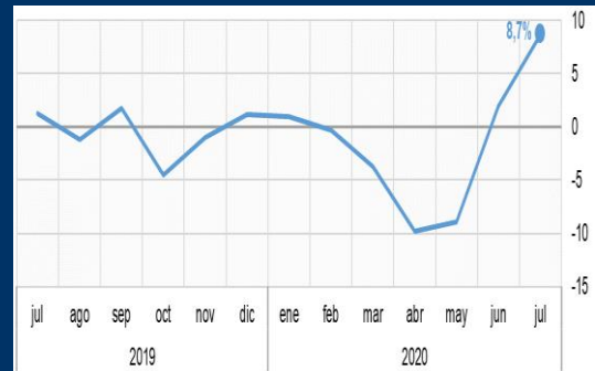
Gráfico 2: Japón - Producción industrial (Variación mensual, en porcentaje)