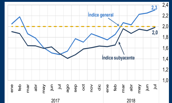
Gráfico 1: EE.UU. - Índice de precios del gasto del consumidor (En porcentaje)