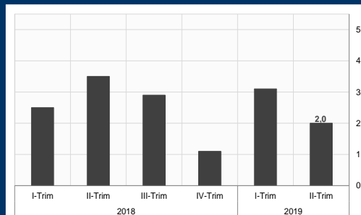
Gráfico 1: EE.UU. - Producto interno bruto (Tasa anualizada; en porcentaje)