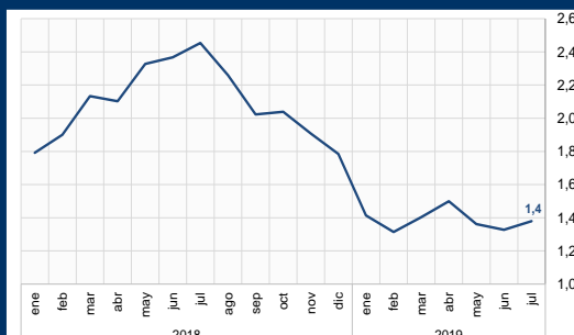
Gráfico 2: EE.UU. - Índice de precios de gasto del consumidor (En porcentaje)