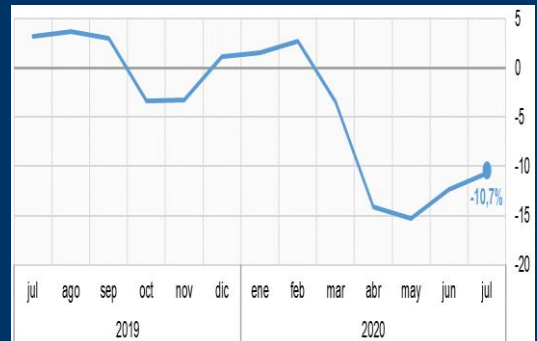
Gráfico 3: Chile - Índice mensual de actividad económica - IMACEC (En porcentaje)