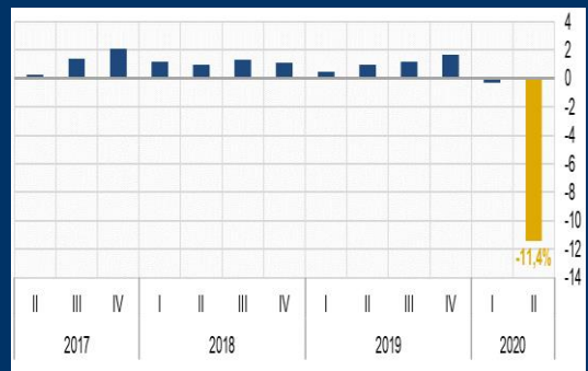
Gráfico 2: Brasil - Producto Interno Bruto (Variación interanual, en porcentaje)