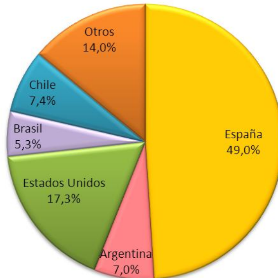
Gráfico 2 Remesas de Trabajadores Según País de Origen 1er Cuatrimestre de 2014 (En porcentajes)