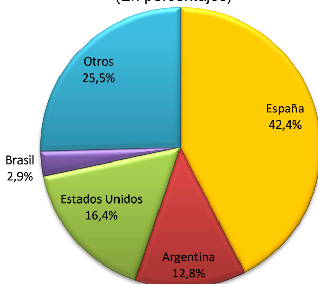
Gráfico 2 Remesas de Trabajadores Según País de Origen: Enero-Agosto 2012 (En porcentajes)