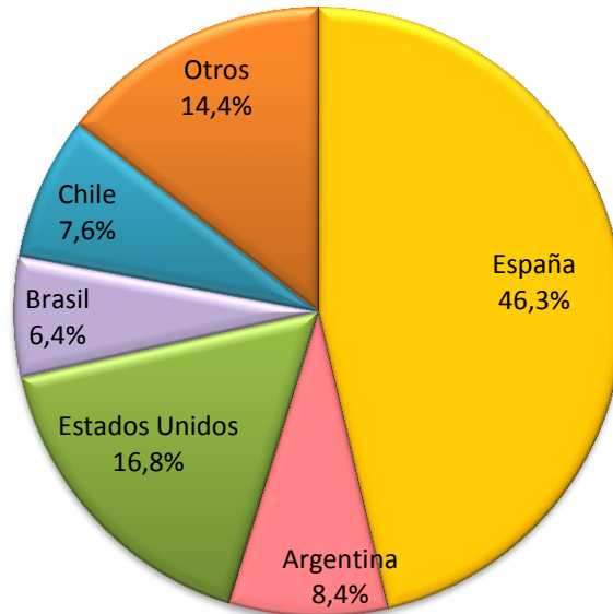
Gráfico 2 Remesas de Trabajadores Según País de Origen A agosto de 2014 (En porcentajes)