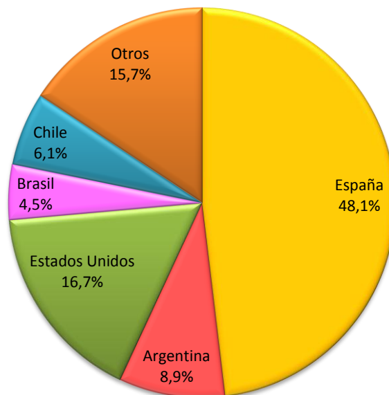
Gráfico 2 Remesas de Trabajadores Según País de Origen Enero - Octubre de 2013 (En porcentajes)