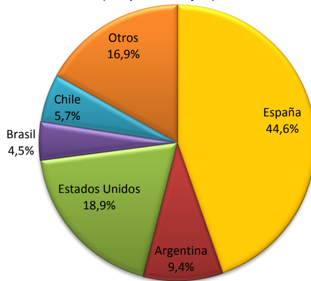
Gráfico 2 Remesas de Trabajadores Según País de Origen A junio de 2013 (En porcentajes)