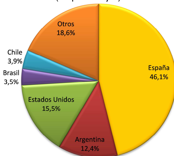
Gráfico 2 Remesas de Trabajadores Según País de Origen (En porcentajes)

Fuente: Sistema Financiero y otros participantes del mercado de remesas Elaboración: BCB