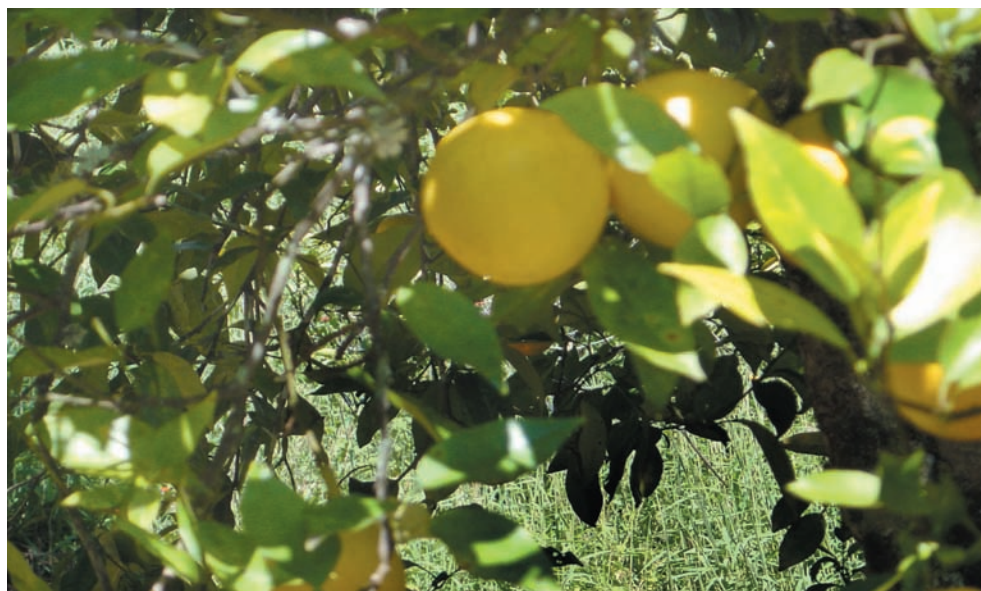
Planta de limón en Cajuata.

Por otra parte, se advierte que del total de la generación de productos, corresponde al autoconsumo un valor de Bs. 1.756, constituyendo en valor relativo el 16%, mientras que la producción destinada al mercado asciende a Bs. 9.043, representando el 84% del valor total de la producción. El elevado grado de inserción al mercado de estas familias probablemente responde a la mayor competitividad de los productos de esta zona frente al de otras zonas, aspecto que ampliaremos más adelante, cuando efectuemos la consideración del subsistema agrícola.