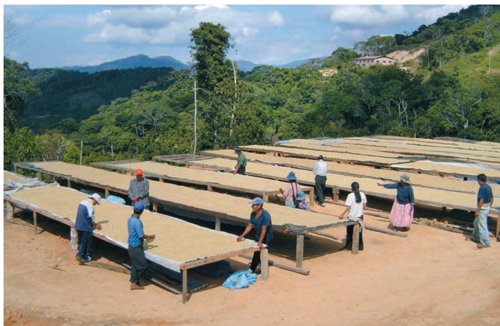
Mesas de secado de café. Cooperativa Calama, Caranavi.