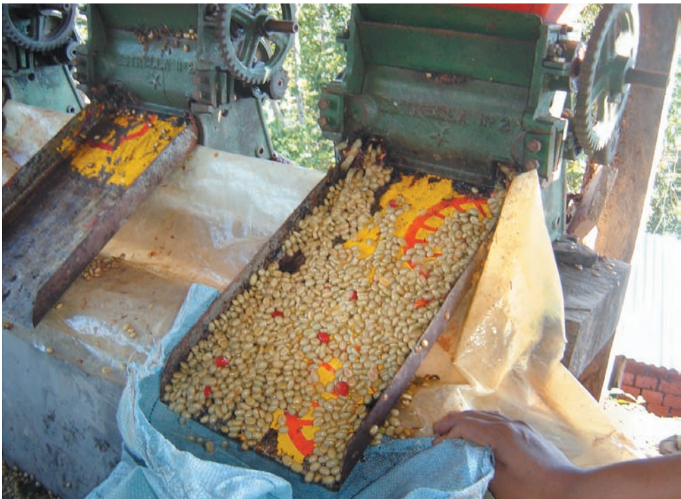
Despulpado de café con máquina desmucilagadora manual.

Con referencia al sistema productivo de las unidades campesinas de los municipios considerados, se establece que los principales componentes del sistema familiar de producción campesina