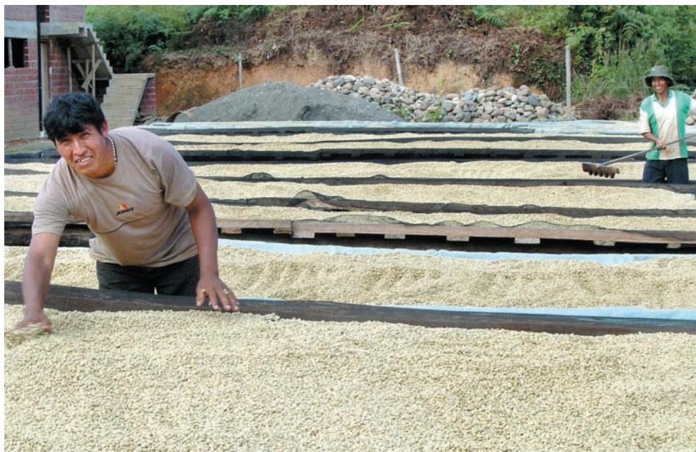
Secado de café Cantón Calama.

trabajo a los que los campesinos pueden acceder no compensa plenamente el empobrecimiento que implica la mayor minifundización, concluyendo en una tendencia a la mayor pauperización campesina.