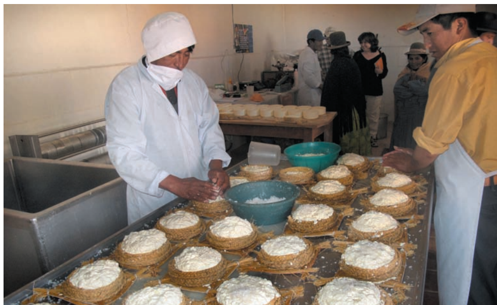
Elaboración de quesos.

Un aspecto particular del destino de la producción en la estructura productiva de la economía de las familias del municipio de Viacha, es que el 89% de la producción agrícola se orienta al autoconsumo y sólo el 11% se orienta al mercado. Una parte importante de este autoconsumo tiene un carácter productivo, puesto que la producción de cebada, avena, alfalfa se utiliza como insumos en la producción pecuaria. Mientras que la quinua en su totalidad y aproximadamente el 70% de la producción de papa se destina al autoconsumo doméstico.