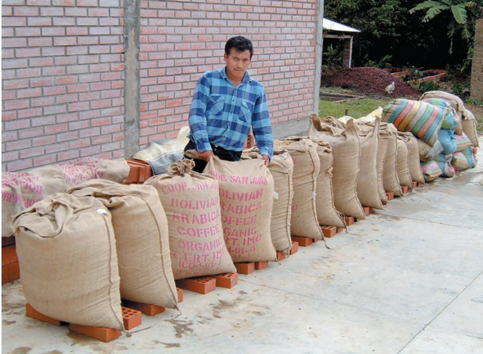
Bolsas de exportación.