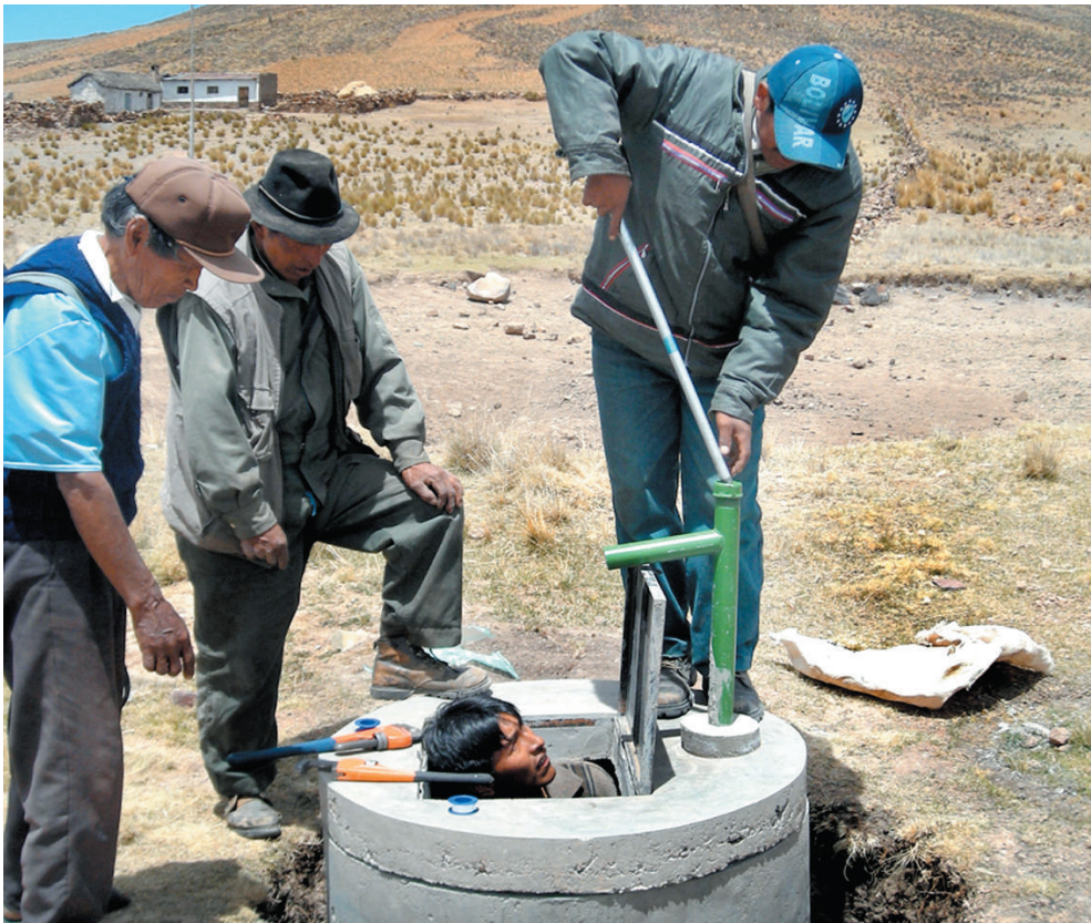
Instalación de bomba manual para agua limpia para ganado. Distrito 3 de Viacha.

Por otra parte, debemos indicar que la relación cuantificada del producto - ingreso corresponde al ingreso neto, es decir que ya se dedujeron los costos de producción. Sin embargo, se debe destacar que en la estructura de los costos de producción, hay una preeminencia de la mano de obra familiar y, a su vez, que los diferentes subsistemas productivos, utilizan básicamente insumos generados en el conjunto del mismo sistema productivo. También debemos indicar que no se dedujo de la estructura del costo total, el costo correspondiente a la mano de obra ni a los insumos generados en la misma unidad productiva campesina, puesto que no constituyen salidas monetarias efectivas. Por lo señalado sólo se consideró el costo de las erogaciones monetarias con fines productivos, que efectúan las familias campesinas en los mercados locales, regionales y otros (los gastos por renovación de sus aperos de labranza y de insumos químicos, estos últimos, excepcionalmente utilizados por estas familias).