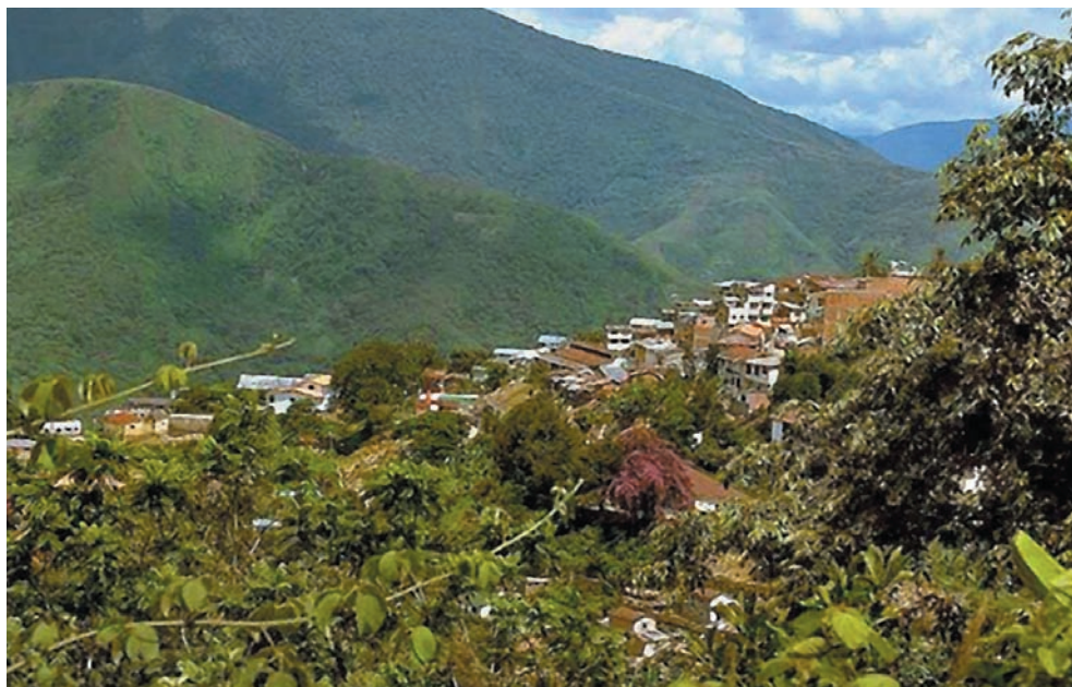
Vista panorámica de la población de Coroico.

En el año 2008 el sistema producto - ingreso de la familia campesina en las comunidades del municipio de Coroico, muestra que el valor de éste asciende a Bs. 16.140,37 conformados por la producción agrícola que contribuyen con Bs 10.829 representando en valor relativo el 67,10%, la producción pecuaria que aporta con Bs. 1.186,42 que representan el 7,35% y la venta de fuerza de trabajo que alcanza a Bs. 4.124, representando el 25,55% del valor total del producto - ingreso. Es importante señalar que entre los periodos 2001 y 2008 ha existido un aumento del aporte de la venta de fuerza de trabajo al sistema producto - ingreso de las economías campesinas de las comunidades de Coroico que va del 14,1% en 2001 al 25,55% en 2008, incremento que puede deberse a la construcción y la dinámica turística dada su cercanía de estas comunidades a las ciudades de La Paz y El Alto, lo que facilitaría la venta de fuerza de trabajo. Mientras que el incremento de los ingresos por el aporte de la agricultura, se da como consecuencia del aumento del precio del café.