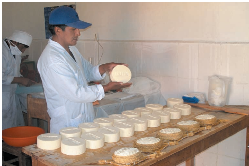
Producción de quesos en la planta de la asociación AMALIC. Distrito 3 de Viacha.

Las técnicas de producción 37 que desarrollan las unidades familiares campesinas en las Áreas de Desarrollo Territorial consideradas, son aquellas intensivas en mano de obra, a partir del uso de tecnologías agrícolas de corte tradicional, las cuales demandan mayor cantidad de energía humana, por cuanto, las actividades agrícolas se desarrollan básicamente en forma manual.