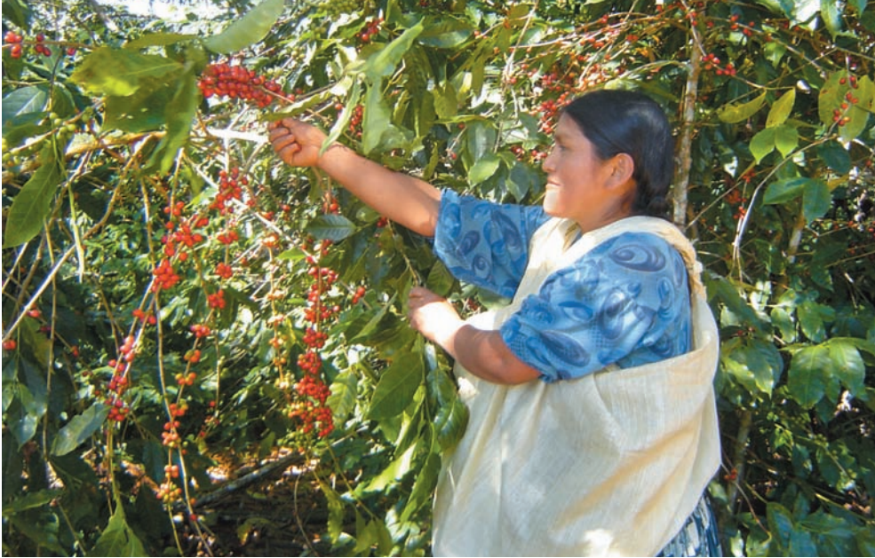
Cosecha manual de café guinda.

El rubro principal de la estructura productiva agrícola de la familia coroiqueña en el periodo 2001, es la producción de cítricos, entre los que cabe destacar la naranja y mandarina. De esta producción, sólo el 12% es autoconsumida.