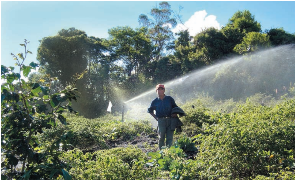
Sistema de riego por aspersión para el cultivo de hortalizas en Cajuata.

El valor relativamente alto de la producción agrícola y la elevada proporción de esta producción que se orienta al mercado, permite deducir la mayor competitividad de los productos agrícolas de esta área, frente a la producción de otros pisos ecológicos. Esto sucede con la papa (el